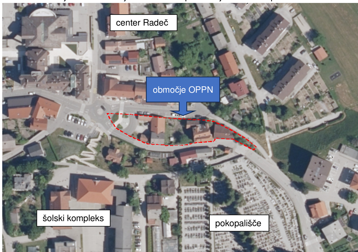
Slika 1: Prikaz območja OPPN za prenovo centra naselja – vzhod (del EUP RA 11/3)

Namen priprave in izdelave občinskega podrobnega prostorskega načrta za prenovo centra naselja - vzhod (v nadaljevanju besedila OPPN) je v prostor umestiti večnamenski objekt, urediti javne prometne površine – predvsem pločnik ob Ulici Milana Majcna, porušiti stavbo Ulica Milana Majcna 17 ter na njenem mestu vzpostaviti javne zelene površine.