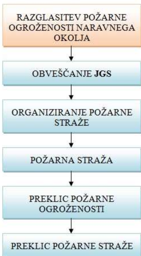
Slika 3-2: Koncept zaščite in reševanja ob NEVARNOSTIH POŽAROV V NARAVI